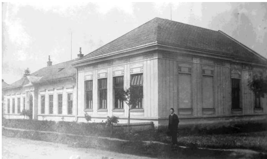
Škola v Říkovících po rozšíření v roce 1910.