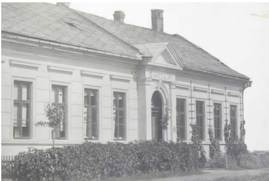
Původní školní budova. Mezi 1892 a 1910.