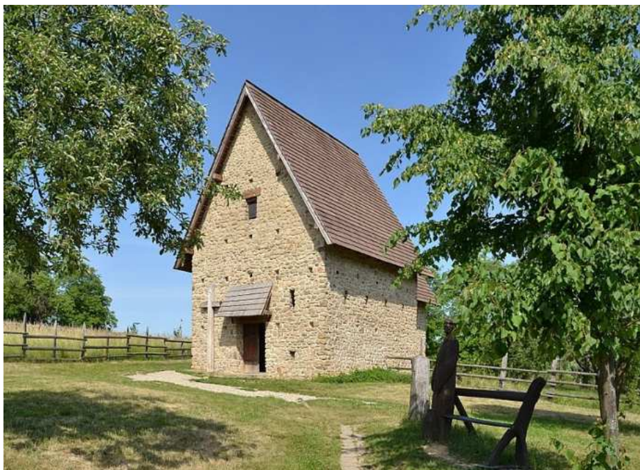
Replika kostela sv. Jana v Modré.