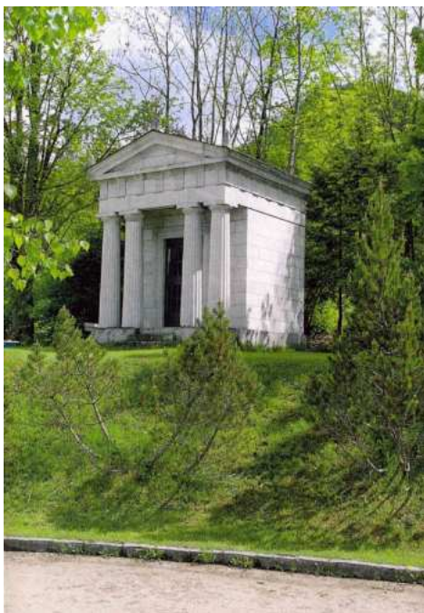
Rodová hrobka Chlumeckých ve štýrském Bad Aussee