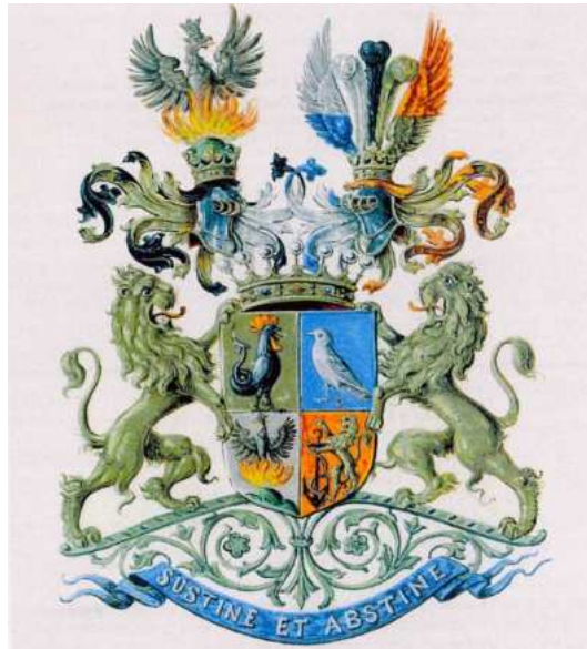
Rodový znak baronů Chlumeckých s heslem „Sustine et abstine“ čili „Odolej a odříkej si“

ně zapojil do společenského života, když jako prezident stál v čele Obchodního muzea a mezi lety 1897 až 1910 i železniční společnosti Jižní dráhy. Za svou činnost byl mnohokrát vyznamenán. Roku 1866 byl dekorován Rytířským křížem Řádu Františka Josefa, 1873 Řádem Železné koruny I. třídy, jmenován byl tajným radou a po odchodu z vlády v roce 1879 obdržel Velkokříž Leopoldova řádu. Roku 1897 získal i Velkokříž Řádu sv. Štěpána a za zásluhy byl