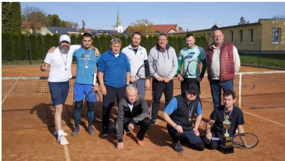
Memoriál Josefa Jurečky

vat, rozvíjet a účastnit se veškerých pořádaných dobrovolnických, kulturních a společenských akcí, které vedou ke zkvalitnění a rozvoji života v naší vzkvétající obci.