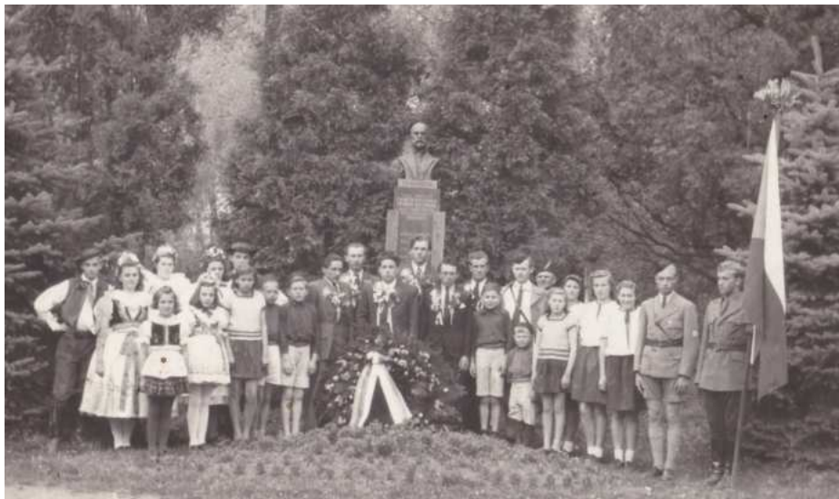
Oslavy vítězství.

Byla vyhlášena pracovní povinnost, aby byl zřízen místo vyhozeného mostu most nouzový. K tomu bylo použito pražců a dřeva, které naši občané rozebrali z vagonů na nádraží a také kolejnice. Ve sladovni bylo zřízeno skladiště proviantu. Němci