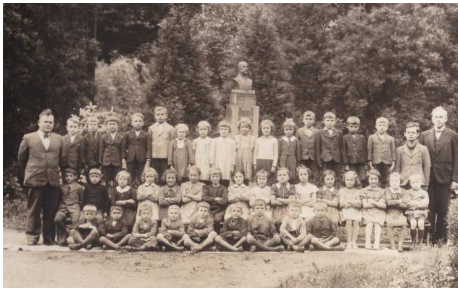
Školní fotografie z roku 1940.

Pro tuto dobu musela být založena nová kronika, ale období, kdy se již nedalo o poměrech pravdivě psát, nastalo již 15. března 1939 zřízením Protektorátu. Než i období pozorný čtenář kroniky vyčte, jak se český učitel díval na situaci. Oslav „Vůdce“ byly dopodrobna a doslovně vypracovány. Na školách vyvěšovány německé hákové prapory a prapory protektorátní. Školy musely české zápisy odstranit a opatřit nápis dvojjazyčný. Než podařilo se nám uchránit pamětní českou desku u vchodu tím, že byla zabeďněna a na bedněni byl dvojjazyčný nápis. Podobně podařilo se zachránit některé mapy, státní znaky, knihy a obrazy před zničením. Odstranil jsem fotografie žáků z kroniky, protože žáci byli fotografováni před pomníkem pana presidenta T. G. Masaryka, na němž byla jeho busta. Busta jednoho dne zmizela (Ukryl ji pan Josef Hovad st.). Na pomník byl dán místo busty dřevěný kříž. Tedy fotografie by byly nevhodně upozorňovaly a vedly by třeba k pátrání po bustě.