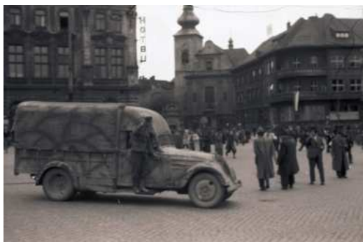
Hlavní náměstí v Přerově během povstání. Zdroj: Muzeum Komenského v Přerově. Fond Fotografie, filmy, videozáznamy a jiná média. Inv. č. F 14369.

1. května. Tento den rozšířila se poplašná zpráva, že je konec války, že je převrat. Zpráva přišla z Přerova na naše nádraží. Než děla duněla zlověstně dále. Byla to