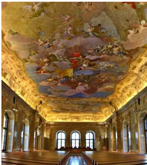
Strop ve sněmovním sálu Stavovského domu v Brně (dnešní Nová radnice), kde do 70. let 19. století zasedal Moravský zemský sněm