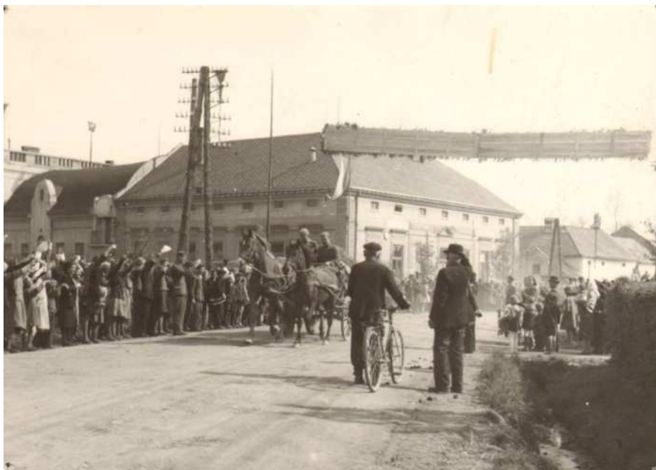
Vítání Rudé armády v Horní Moštěnici.